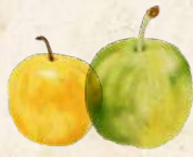
MIRABELLEN & RENEKLODEN