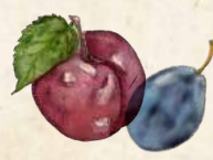
PFLAUMEN & ZWETSCHGEN