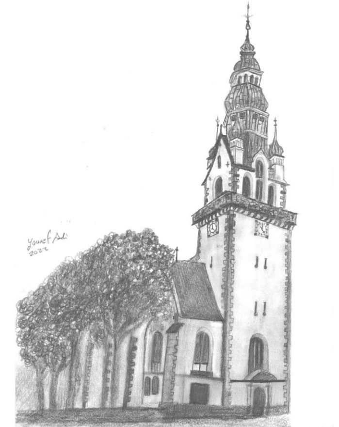
Ali, Yousef; Leiter des Malkurses für geflüchtete Kinder und Jugendliche im Zollhaus seit August 2022